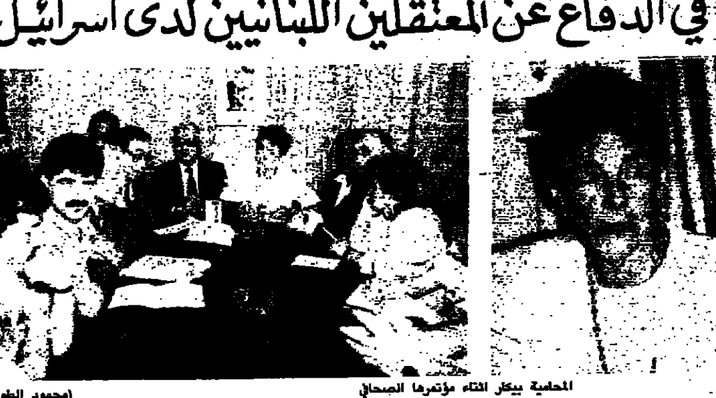
الحمية بيكار أثناء مؤتمر الصحافي

اعتبرت الحماية الفرنسية مرتكب بيكار، من الحاصلات العسكرية الاسرائيلية للمقربين اللبنانيين مسخرة قضائية، مؤكدة على وجوب اطلاق جميع الموقوفين اللبنانيين في كل قطر القوقاز محترمين بشكر تحميمي. ووضعت عن استجوابها على تقويض رسمي من اركان الحكم اللبنانيين خارجة مهمتها.